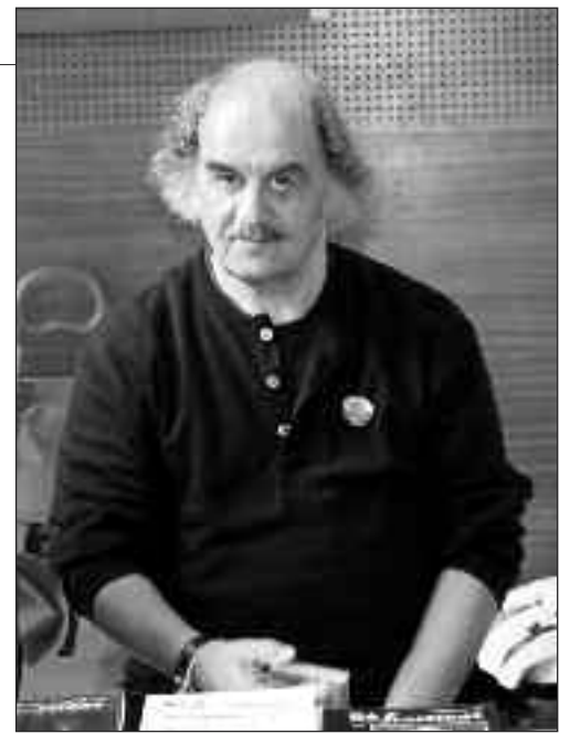
Un des fameux « André Bernard » du chantier de Nangis (voir ML n°24)

Mais les désaccords sont importants. Adhérer à la lutte contre le colonialisme, n'est-ce pas soutenir le nationalisme et l'exercice de la violence ? Pour certains, la phase État nation est inévitable. Lors du congrès de 1960, la Fédération anarchiste décide : « Nous ne pouvons rester absolument neutres. (...) Dans les semaines, les mois à venir, la FA